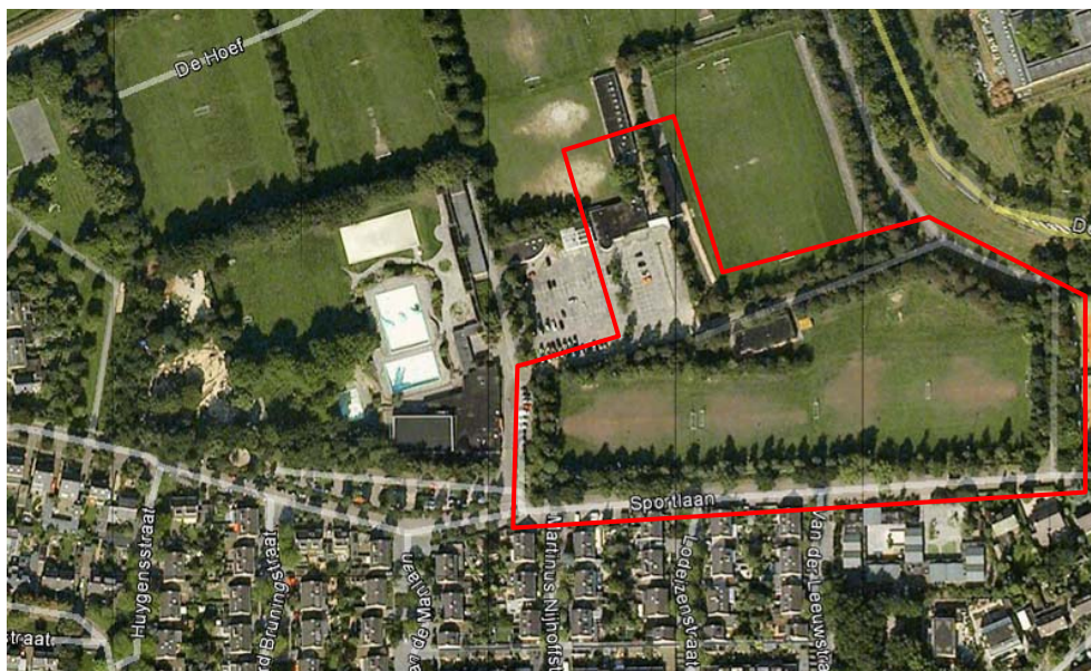
Afbeelding 1. Onderzoekslocatie

Het onderzoeksgebied bevindt zich ten noorden van de Sportlaan in Rosmalen. Op afbeelding 1 is het onderzoeksgebied globaal gemarkeerd. Voor de ontwikkeling van project De Hoef Zuid moeten 129 bomen gekapt worden. Daarnaast wordt nog onderzocht of 36 bomen ingepast kunnen worden in het ontwerp.