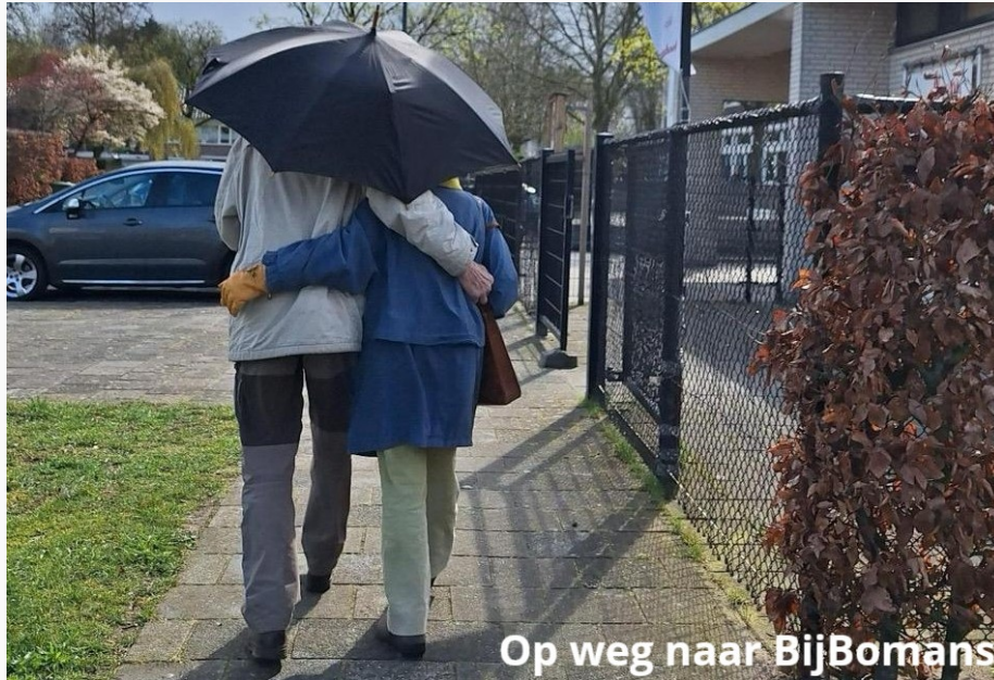
Op weg naar BijBomans