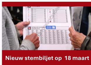
Nieuw stembiljet op 18 maart

's-Hertogenbosch doet bij deze verkiezing mee aan een landelijk experiment met een kleiner stembiljet. Kiezers kleuren twee bolletjes rood: één voor de partij en één voor het nummer van de kandidaat. Het nieuwe ontwerp helpt ook blinde en slechtziende kiezers beter. Kandidaten staan niet meer op het stembiljet, maar op een losse kandidatenlijst die vooraf thuis wordt gestuurd en ook in elk stembokje ligt. Lees meer Weet je nog niet op wie je wilt stemmen? Probeer dan eens een stemwijzer. Lees meer